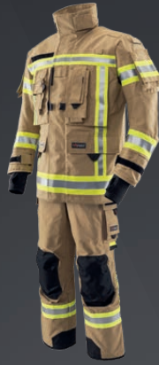
IB-TEX® Gold 010