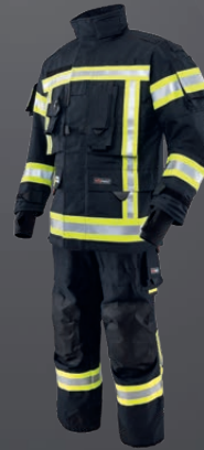
Nomex® NXT Dunkelblau 203

TEXPORT® GmbH Franz Sauer Str. 30 5020 Salzburg, Austria ☎ +43 (0)662 423 244 📠 +43 (0)662 423 243 ✉ office@texport.at 🌐 texport.at