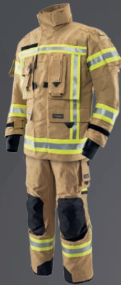
PBI® MATRIX® Gold 010