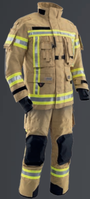
PBI® NEO® Gold 010