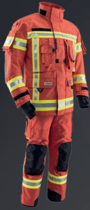
IB-TEX® Rot 151