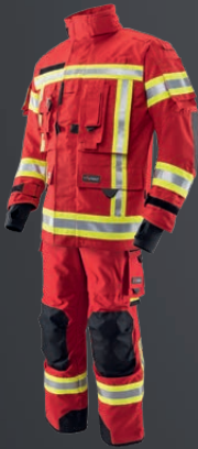
Nomex® NXT Rot 151