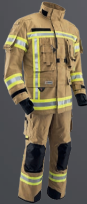
Nomex® NXT Gold 010