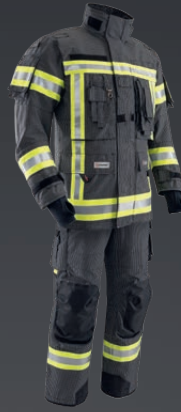
IB-TEX® Dunkelblau 203